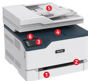
Equipo multifunción color Xerox® C235