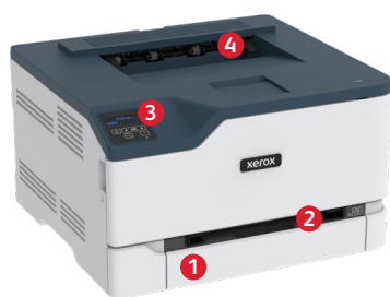
Impresora color Xerox® C230