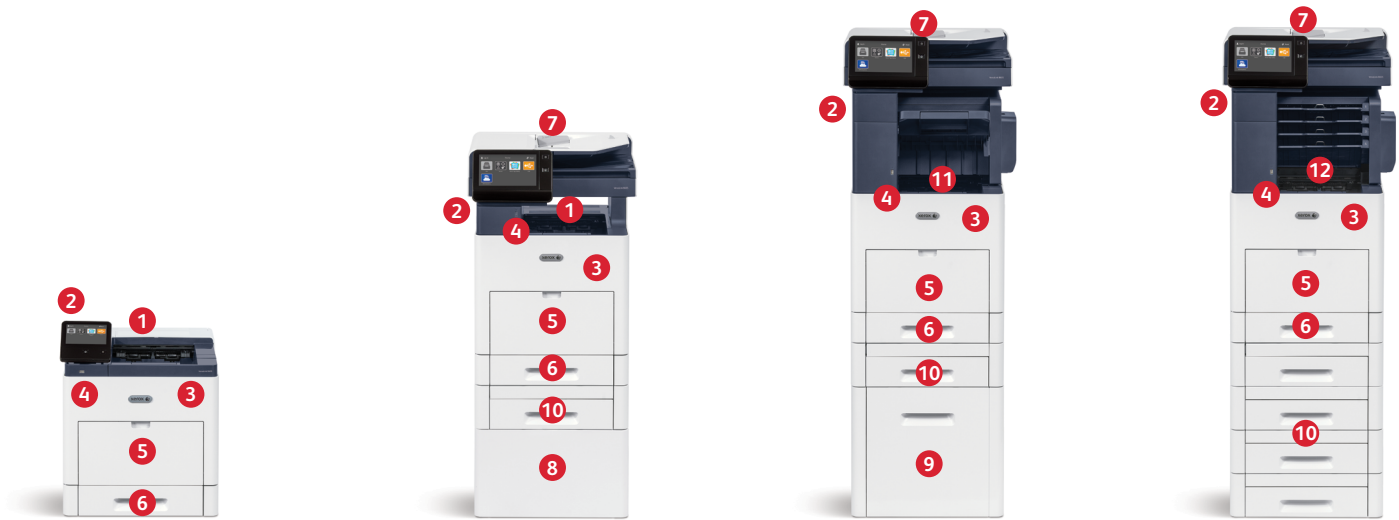
Impresora de color Xerox® VersaLink® C600 Imprime. Conectividad móvil.