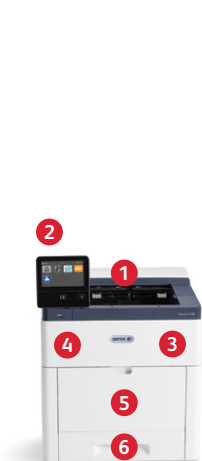
Impresora a color Xerox® VersaLink® C500 Impresión.