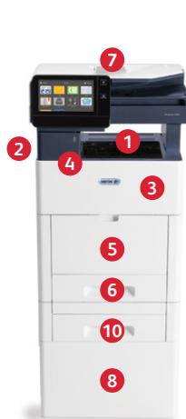
Impresora multifunción a color Xerox® VersaLink® C505 Impresión. Copiado. Escaneado. Fax. Correo electrónico.

1 Bandeja de salida para 500 hojas (C500) o 400 hojas (C505) con sensor de bandeja llena.